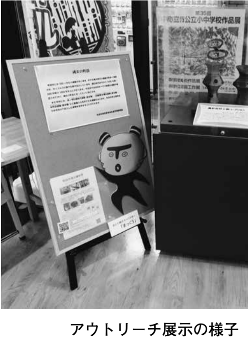
アウトリーチ展示の様子

文化スポーツ振興部長 要件整理の打合せには国際版画美術館職員は入っていません。 小田急・JR町田駅 のホームドア整備など安全対策バリアフリー促進を問う。 都市づくり部長 小田急線町田駅のホームドア整備は、22年度以降、順次、供用開始であると聞いています。JR町田駅は、ホームドアが未整備の2番、3番ホームは、設置予定はないと聞いています。